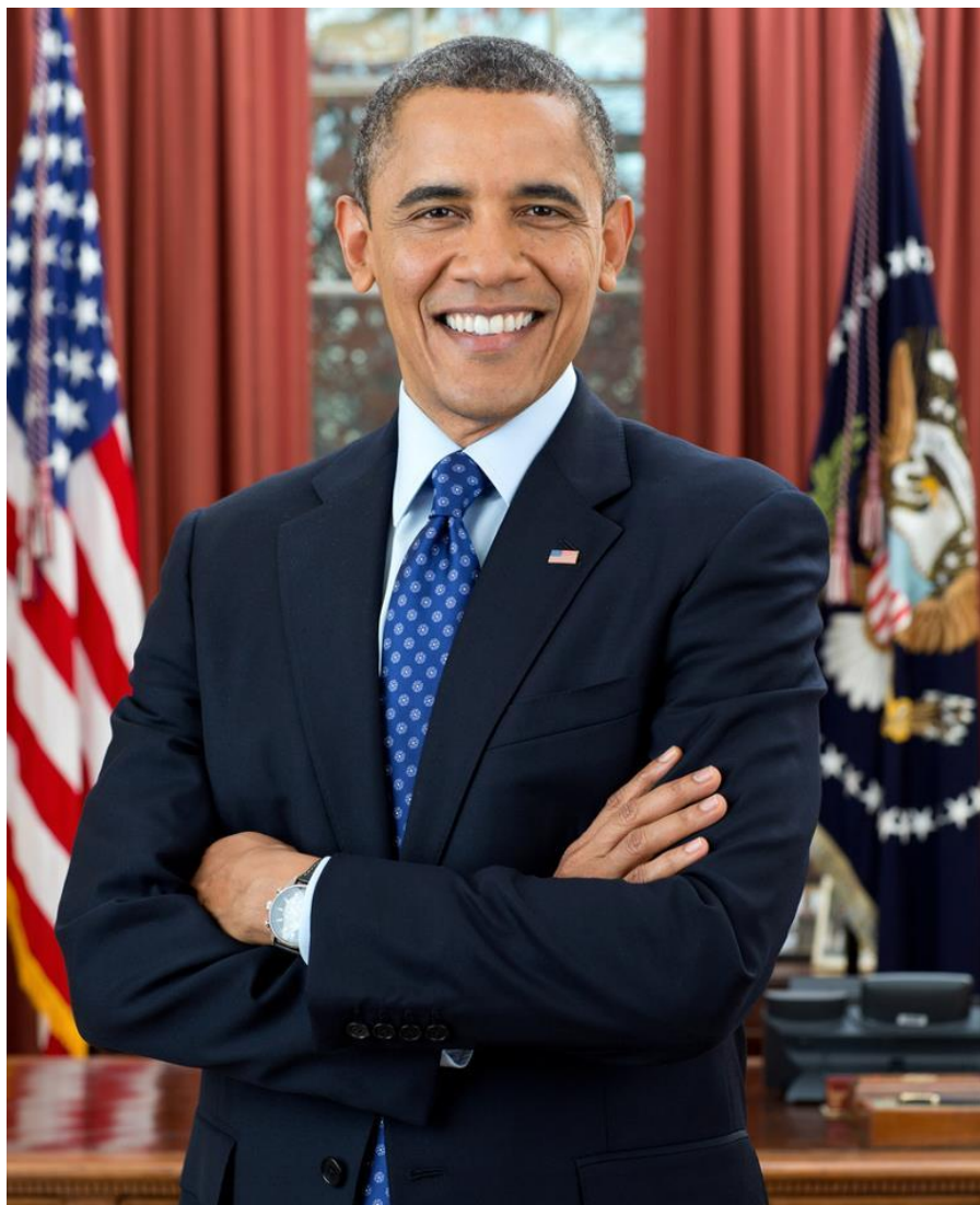
Рисунок 2. Б. Х. Обама.